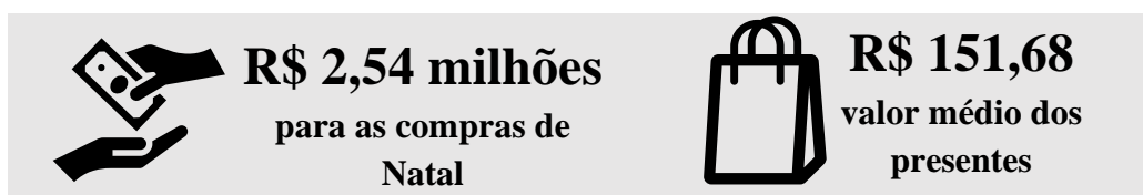
Figura 1: Projeções de vendas para o Natal

A pesquisa foi aplicada via internet utilizando a plataforma Google Forms e contou com 115 respondentes. A partir dos dados coletados, foi possível projetar que as compras para o Natal e utilização do 13º salário. Projeta-se movimentação de R$ 2,54 milhões para a compra de presentes de Natal, se mostrando como a segunda data mais lucrativa, ficando atrás apenas do Dia das Mães, para o comércio local, estima-se o gasto de R$ 1,86 milhões para a compra de presentes. O ticket médio do valor da compra é de R$ 151,68.