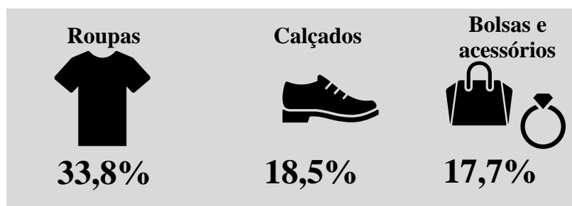
Figura 4: Produtos que pretendem comprar para presentear

Com relação a forma de pagamento, a maioria dos entrevistados mostrou preferência para o pagamento à vista (68,4%), sendo que 48,1% afirmaram que pretende pagar em dinheiro e/ou cartão de débito e 20,3% devem pagar com o cartão de crédito à vista. Por outro lado, 22,8% devem pagar as compras no crédito parcelado.